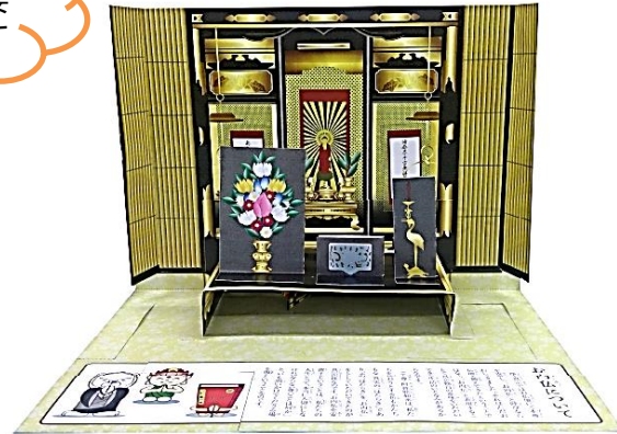
組立後(全体のサイズは A3 二つ折とほぼ同じ)